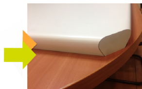
Se debe hacer corte 45° y enchapar

We deliver the 3 and 4-sided table covers cut at the corners, but you must specify if you want them veneered or if you will veneer them yourself for faster delivery.